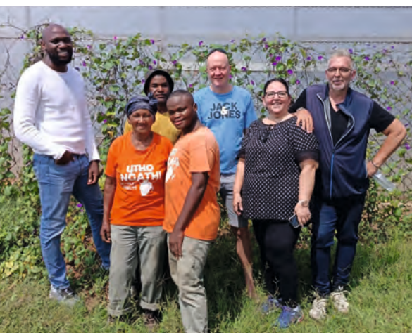
Besuch beim Inklusionsprojekt Gemüsefarm Soweto

Auch dass durch die Touristen-Straße bei Nelson Mandelas Haus in Soweto am Wochenende die nobelsten Autos fahren und gleichzeitig die Hilfsbereitschaft bei der eigenen Mama, Tante oder Oma endet, ist für uns befremdlich.