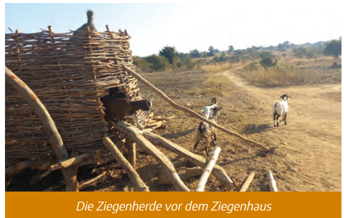
Die Ziegenherde vor dem Ziegenhaus

Unser Inklusionsprojekt „Ziegen für Menschen mit Behinderungen im ländlichen Sambia“ hat schon viel Positives bewegt. Die Menschen, die von Utho Ngathi in diesem wichtigen Projekt die Ziegenherden bekommen haben,