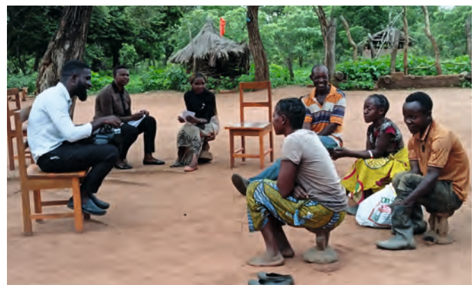
Mit dem TV-Journalist zum Dorfbesuch