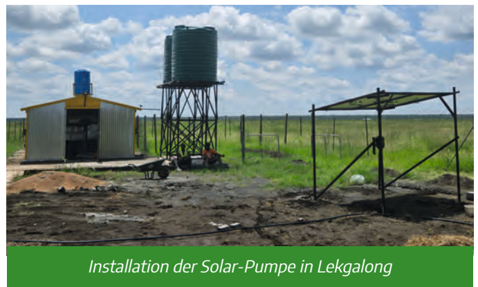
Installation der Solar-Pumpe in Lekgalong

Bei der Entwicklung unseres Inklusionsprojekt Lekgalong ist immer etwas los. Wir werden oft um Wochen zurückgeworfen, weil wir seit November auf die Installation unserer Solar-Pumpe für das Grundwasser warten. Seit wir im Oktober einen Geologen beauftragt haben, die bestmögliche Stelle für die Grundwasser-Bohrung zu finden, warten wir nun auf die Firma für die Installation der Pumpe. Immerhin haben wir aber endlich zwei 5000 Liter-Wassertanks installiert bekommen.