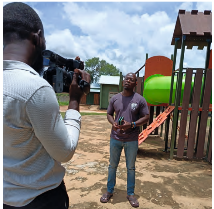
Masaso im TV Interview

Ich hoffe, Ihr habt nun wieder einen guten Einblick in unser Leben, unsere umfangreiche Arbeit und den neuesten Stand bei unseren Projekten bekommen.