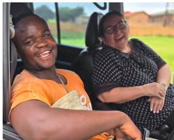
Kennenlernen durch Gespräche und Zuwendung