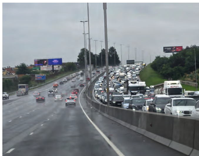
Johannesburg und der ständige Stau

Das Leben im Südlichen Afrika hat sehr viele Facetten. Man kann diese eigentlich nicht in wenigen Worten beschreiben. Es fängt ja schon damit an, dass wir mehrere Stunden am Tag in Verkehrsstaus verbringen, um auf die Arbeit nach Soweto oder in unser Büro bei Evonik Africa zu kommen und auch die vielen anderen Aufgaben in der Großregion um Johannesburg zu bewältigen. Das größte Problem besteht darin, dass es keine guten öffentlichen Verkehrsmittel gibt. Daher sind in der 10 Millionen-Stadt Johannesburg die meisten Menschen der arbeitenden Bevölkerung in ihren Autos oder in tausenden Sammeltaxis unterwegs. Die Taxistände liegen in der Innenstadt, diese zu nutzen würde für mich viel (!) zu gefährlich sein. Um kurz einige Zahlen zu nennen: Die Strecke von meinem Zuhause in Alberton - im Süden Johannesburgs - bis zu unserem Büro im Evonik Africa-Gebäude in Midrand beträgt 45 km, und dies fast nur auf der Autobahn. Seit Beginn dieses Jahres brauche ich hierfür jeden Morgen mindestens 90 Minuten. Auch am Nachmittag sieht es ähnlich aus. Bei den vielen Unfällen auf den Straßen kann es auch schon mal 2 Stunden dauern, um die 45 Kilometer zurückzulegen. Eine Herausforderung, die natürlich auch an den Kräften zehrt. Das Positive am Büro bei Evonik ist, dass wir dort sicher arbeiten können. Außerdem sind wir immer nah an den Mitarbeitenden und dem Management von Evonik