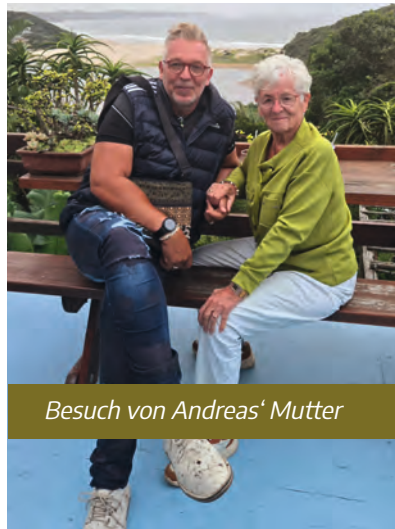
Besuch von Andreas' Mutter