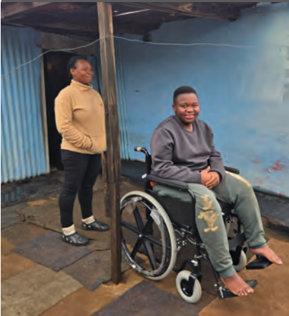
Hausbesuchsprogramm in Soweto